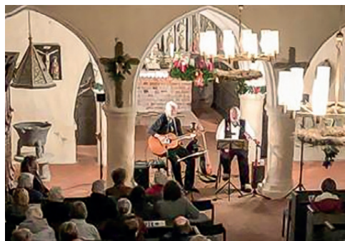
Auftritt in der Kirche von Mulsum: „Lütt un Lang“ in Aktion.