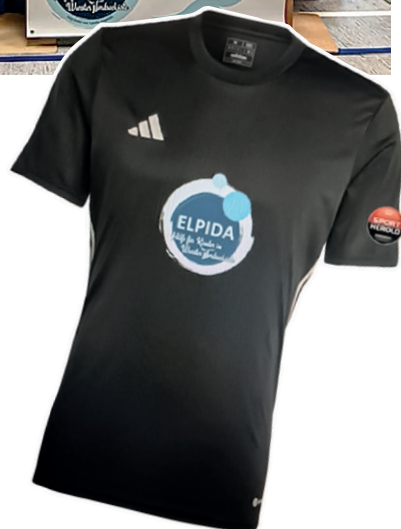
Mitte rechts: Das Trikot der neugegründeten Fußballmannschaft der Oberschule mit dem ELPIDA-Logo.