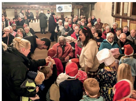
Gespannte Aufregung bei den Kleinen vor dem Auftritt.

Am ersten Advent wurde in der Mulsumer Kirche wieder ein Benefizkonzert in Form einer plattdütschen Vörwiehnacht mit Lütt un Lang vom Blancke Trio veranstaltet. Diese Veranstaltung wurde von der Familie G. und H.-J. Iben Stiftung bezuschusst. Kleine Sänger und Sängerinnen vom Kindergarten Wremen haben uns dabei tatkräftig unterstützt! Die Kirche war wieder voll besetzt – am Ende konnte sich ELPIDA über einen Überschuss in Höhe von fast 1.300 Euro freuen!